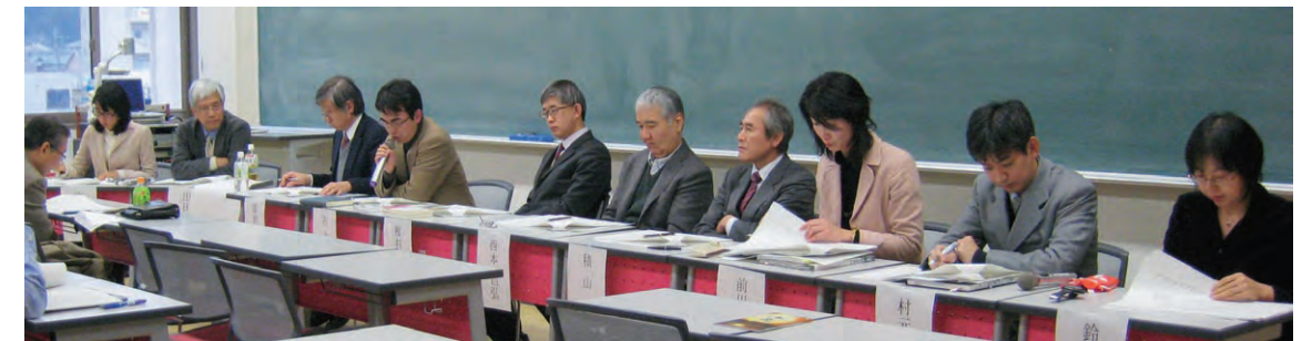
都城制研究集会でのシンポジウムの様子

In addition to carrying out its own activities, since fiscal year 2009 this center has taken on the accomplishments of the "21st Century COE Program - COE for Research on formation and characteristics of Ancient Japan", and is widely promoting and releasing interdisciplinary research on ancient Japan in concert with researchers from the field of science. Accordingly, greater development can be achieved through cooperation with the network of domestic and foreign research institutions and researchers built through COE activities.