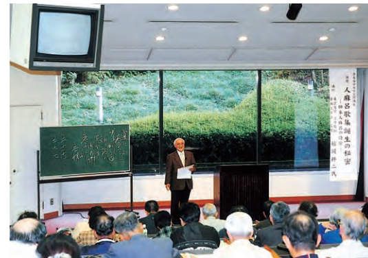
公開講座「人麻呂歌集誕生の秘密」

The Center will survey the promotion of lifelong learning as well as conduct research and development of lifelong learning programs by liaising with local lifelong learning organizations and groups.