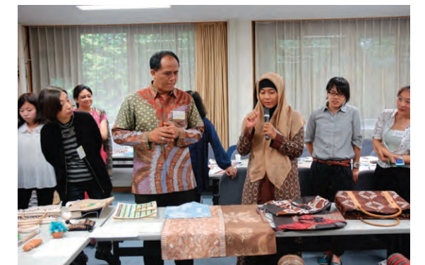
シンポジウム "Sharing Gender Issues in Asia" のフェアトレードのセッション

Established on November 25, 2005, the Center is dedicated to promote higher and further education for women in Asia. In present-day Asia, with its great diversity in history, culture, language, economic development and political systems, there is a common experience and a sense of unity derived from living in Asia. This center aims at providing students and researchers in Asia with mutual understanding and ways to find solutions to current gender issues. The Center underlines the importance of gender equality by conveying the findings obtained through the research, the exchange of researchers, the nurturing of the next generation and the contribution to the community.