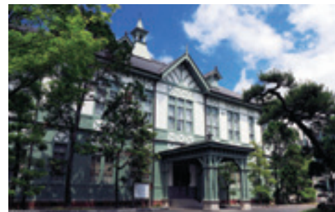
記念館(重要文化財) Memorial Hall (Important Cultural Property)