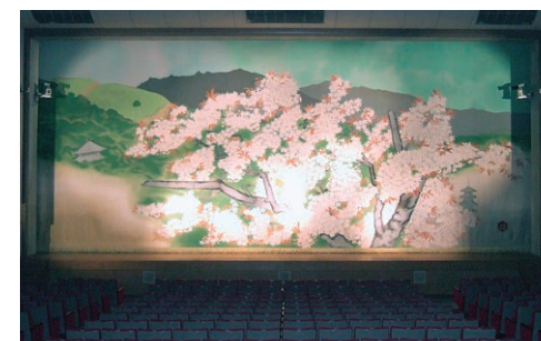
講堂緞帳「爛漫」(原画 小倉遊電画白) A thick Curtain "RANMAN" by Yuki Ogura in the Auditorium