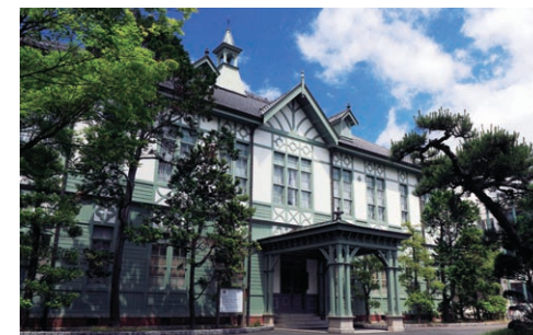
記念館(重要文化財) Memorial Hall (Important Cultural Property)