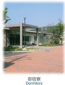
寄 宿 寮 Dormitory