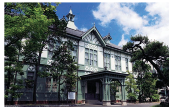
記念館(重要文化財) Memorial Hall (Important Cultural Property)