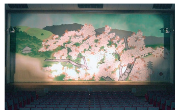
講堂緞帳「爛漫」(原画 小倉遊電画白) A thick Curtain "RAMMAN" by Yuki Ogura in the Auditorium