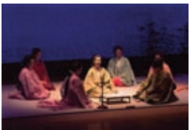
披露（ひこう）で「発声」をつとめる（前列左）

幼時から病気がちの日々を過ごし、何をしても続かなかったが、不惑を過ぎた頃に、老後のために何かを始めようと思った。何でもよいが、耳順まで続けられ楽しめるのではないかと。そこで長年憧れていた香道を始め、二十年ほど中断していた冷泉流の和歌を再開した。この時「①稽古を休まないこと②困難なことにも逃げないで挑戦すること」の二つを自分に課した。それは香道志野流全国大会でのお手前や冷泉家の披露にも積極的に参加するということと繋がる。私