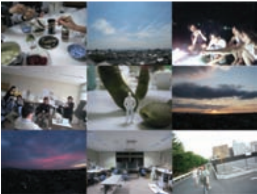
楽しい時も苦しい時も一緒に過ごした友人達

それに対する意見をもらう、そのプロセスを楽しめるようになっていくことに気づいた。「何かを創る」ことは、一人でできることではなく、自分がいかに考えどんなモノを創りたいのかを人に伝えて、初めて叶うものだと知った。そして、チームで作品を作るコンペへの参加や、他大学と合同の展覧会への出展・運営を通して、人と関わり「何かを創る」ことの難しさ、それを乗り越えた時の喜びを知った。