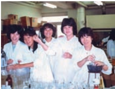
学生実験風景(右端が本人)

気がついてみれば奈良女子大学卒業から二十年以上の歳月が流れました。秋田県の男鹿半島で生まれ育った私が遠く関西の奈良女子大学に進学したのは父の影響が強くなります。秋田では父の教師をしていた父は、修学旅行で奈良を訪れる機会が幾度となくあり、娘のひとりをおの古都の大学に入れたと思ったそうです。四年間入居できる寮があるというのも理由のひとつでした。地方出身で三人兄妹という経済的な理由だけではなく、父自身が学生時代寮生活を送り生涯の友を得た経験から、寮のある大学はいいと強く薦められました。私はといえば、ただ親元から独立したい一心で受験勉強に励んだものです。