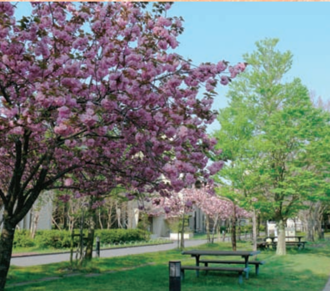
大学構内の桜満開 (奈良女子大学メールマガジン-150号より)