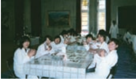
小豆島での研修旅行

そして、大学で何より食を愛する仲間に出会えたことが私にとって、とても大きな収穫であった。共に勉強した時間、みんなで行った研修旅行、疲れた時に一緒に食べたス