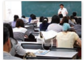
学外にも公開された授業

文学部では、6月6日からの1週間を「東日本大震災ウィーク」とし、この週に実施された一部の授業において「震災」をテーマに取り上げ、学生に「震災」について考える場を提供しました。この度の震災にあたり、教育・研究機関としての大学にできること、とりわけ文学部という社会・文化・言語・人間に関わる教育・研究を行う場所においてできることを模索した上で、震災について授業の中で学生とともに思考するといった取組を行いました。