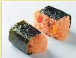
県産の食材を使用したおにぎり

本学の食物栄養学科ヘルスチームが開発した商品は「直巻おにぎりヤマトポークの生姜焼き」。ごはんには一部奈良県産うるち米を、豚肉も奈良県産「ヤマトポーク」を使用した生姜焼きのおにぎりです。彩りと食感のアクセントにピーマンを入れ、奈良県の食材を手軽に楽しめるおにぎりになりました。