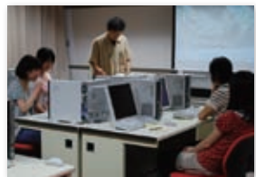
学生が主体的に支援を企画

キャリア教育科目として「震災支援の企画と実践」を開設しました。この授業では、災害支援に関する研究実績に触れ、今回の震災をめぐる諸情報を収集・分析した上で、必要とされる支援について学生が主体的に企画・実践することを目的としています。受講した学生は、奈良という遠隔地からでもできる支援を企画し、学内や近鉄奈良駅前などで行った募金活動・学内でのチャリティバザーでの収益を元に、仮設住宅や被災者宅へ家電を送るとともに、仙台フィルを応援する募金への協力も行いました。また、大学近くの蒲鉾店や幼稚園の協力を得て、カラフルな手作り表札を仮設住宅に送りました。被災地のニーズは、被災者支援のWebサイトから情報を収集するとともに、仮設住宅に住む人に直接電話で確認しました。さらに紙媒体による通信やブログを用い、支援活動についての積極的な情報発信もしました。