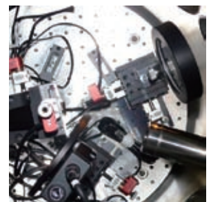
顕微鏡装置の内部

この研究成果は、8月21日から米国サンディエゴで開催された光学・フォトンクス分野で最も権威のある国際光工学会の国際会議 (Optics+Photonics 2011) において発表されました。