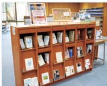
学生の視点で選ばれた図書

附属図書館では、定期的なさまざまなイベントを企画して図書の展示を行っております。展示された図書はもちろん貸出可能です。