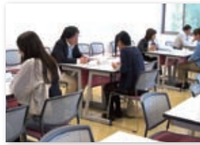
学科・コース別に個別相談

本学では、全国各地で開催される入試説明会へ赴いて入試広報活動に努めており、その一環として、第3年次編入学希望者を対象とした入試相談会を年に2回、大学キャンパス内で行っています。春に実施した理学部・生活環境学部希望者を対象とした相談会に引き続き、出願期間を目前に控えた10月1日、文学部編入学希望者を対象とした相談会を開催しました。