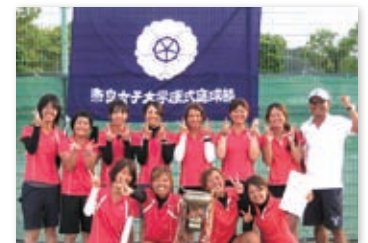
優勝した硬式テニス部

近畿地区国立大学体育大会が今年も8月に開催され、各種目で熱戦が繰り広げられました。本学は12種目に出場し、硬式テニス部が優勝、卓球部が準優勝、弓道部が第4位の好成績を残しました。