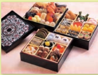
お重の意匠にもこだわり

本学の「奈良の食プロジェクト」とならコープは、おせち料理を共同開発しました。2010年12月から取り組んできたこの企画は、「奈良の食プロジェクト」が一段すべてを担当し、食材の産地見学から数多くの試作を重ねてきました。完成した「特選おせち三段重」は、地元奈良県産の食材をふんだんに使い、奈良にこだわったものとなっています。一つ一つのメニューの名前にもこだわり、「うりバーグ(なら漬け入りハンバーグ)」など、学生ならではの斬新なアイデアが詰まっています。