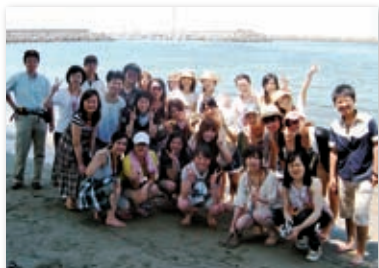
留学生との交流事業

もとより交流を強く望む学生らが参加してきていますが、積極的に留学生と打ち解けようとする日本人学生が多く、当日も和やかに会話が弾んでいました。昨年同様泉州岡田浦で地引網とバーベキューを体験しました。お土産に獲れた魚を持ち帰り、頑張って調理した模様は、各人の参加報告書からも伺えました。今後も、工夫をして交流の機会を検討していきます。