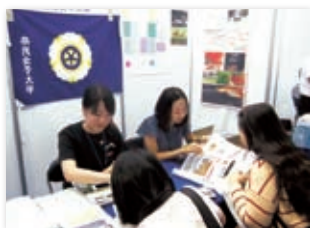
元交換留学生が通訳

9月17日及び18日に、韓国(ソウル・プサン)で開催された日本学生支援機構(JASSO)主催の留学フェアに参加しました。本学ブースには、合わせて120名以上の学生が訪れました。通訳として元交換留学生が大いに活躍し、本学の