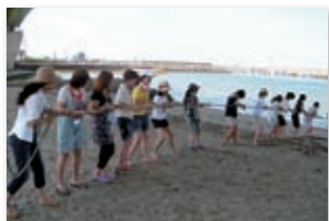
日本人学生も奮闘

今年で4回目となる日本人学生と留学生の交流を図るためのイベントを、8月9日に実施しました。参加者に事前オリエンテーションとお互いの交流を深めるために、ウォームアップゲームを行いました。