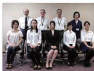
奨学金授与者とともに

なお、この事業の実施から今年度までの奨学金授与者は、延べ134名にのぼっています。