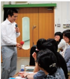
けん玉を使った授業に興味津々

国際協力の現状と課題について理解を深め、将来を見据えた国際協力のあり方や具体的方策を提案できるよう基礎的な知識を養うとともに、国際的に活躍できる女性人材の育成を目指して、全学共通科目「異文化理解と国際協力」を新設しました。授業では、独立行政法人国際協力機構 JICA 大阪の協力のもと、JICA 青年海外協力隊 OB 等をゲストスピーカーとして招聘し、派遣先国の社会の現状と、日本が現在実践している国際協力の具体的な事例について学び、ディスカッション等を通して女子大学・女子学生としてできる国際協力のあり方について考え、理解を深めます。